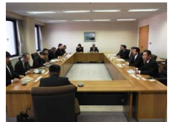
2013.2.9 滋賀県議会「地域主権・広域連合調査特別委員会」来訪(議会棟にて)